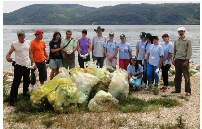
23 mai 2012 - igienizarea malului Dunării la Stara Palanka

Participanții la monitorizare au apreciat că dacă în cazul ambalajelor de pe Dunăre se poate presupune că acestea provin din toate țările riverane din Europa, în cazul ambalajelor din Delta Nerei acestea provin în cea mai mare parte din localitățile din România situate pe cursul râului Nera.