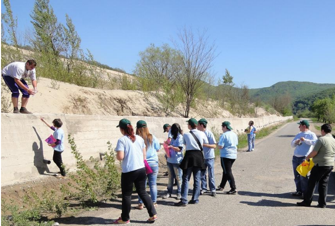
27 aprilie 2012 - Monitorizarea calității mediului în zona haldei de deșeuri miniere de la Sasca Montană

această etapă a programului au participat un număr de 30 de tineri voluntari de la Grupul Școlar Agricol Oravița, Grupul Școlar Industrial „Mathias Hammer” Anina, Asociația “Aurora” Bela Crkva, Universitatea de Vest Timișoara, Universitatea Politehnică Timișoara și Direcția Silvică (Banatșume) Pančevo care activează în centrul de voluntariat al GEC Nera.