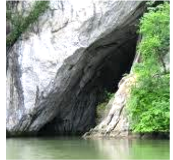
Intrarea în Peștera Ponicova din Dunăre.

Peștera Ponicova este situată în Muntele Ciucaru Mare pe care îl străbate până în Cazanele Mari. Intrarea principală, cea mai accesibilă în peștera este situată în Cheile Ponicovei unde se ajunge din DN57, coborând pe lângă podul de peste pârâul Ponicova și continuând mersul pe vale până la intrarea în peșteră. Lungimea totală a galeriilor peșterii este de 1666 m. Peștera are o galerie principală activă cu înălțimi de până la 26 m. La cca. 20-30 m deasupra acesteia se găsesc două galerii fosile dintre, care una adapostește o colonie de lilieci. Peștera este ocrotită prin lege în cadrul Parcului Natural Porțile de Fier.