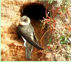
Lăstunul de mal (Riparia riparia)