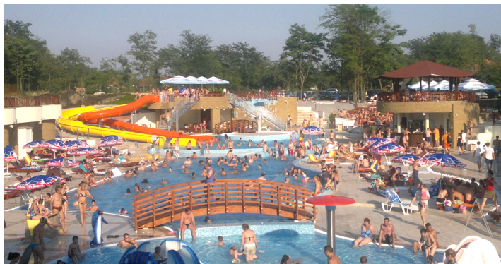
Complexul turistic Srebreno Jezero din Veliko Gradište

Promovarea acestor două programe constă în a oferi informații grupurilor de turiști în perioada de pregătire a tururilor precum și servicii de ghid voluntar pe perioada de operare a tururilor turistice.